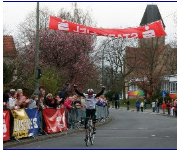
.. und etwas später ..