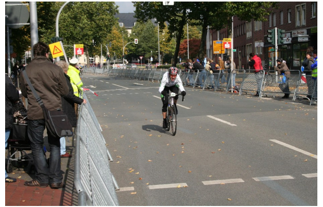
200m Marke und jagendes Feld