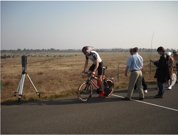
Am Start zum Zeitfahrtsieg